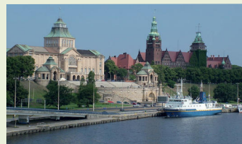
Stettin: Hakenrassen

7:00 Uhr Abfahrt in Emsdetten, Hengeloplatz, Ankunft ca. 15:00 Uhr in Stettin . Übernachtet wird in einem zentral gelegenen Hotel.