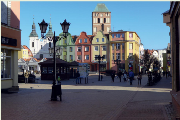
Chojnice: Marktplatz mit Basilika und Jesuitenkirche im Hintergrund

Mit zwei Übernachtungen in Stettin, einer Stadtführung und einem Ausflug nach Swinemünde auf der Hinfahrt, viel Programm in Chojnice, einem Ausflug nach Bydgoszcz und optional einer Zwischenübernachtung in Rostock auf der Rückfahrt.