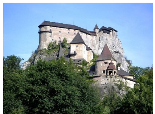
Arwaburg (Oravský hrad) - Foto: Wojsyl

Etwa 2 km hinter Podbiel stehen die Reste eines Hochofen- und Hammerwerks im klassizistischen Baustil von 1837, jetzt nur noch Ruinen.