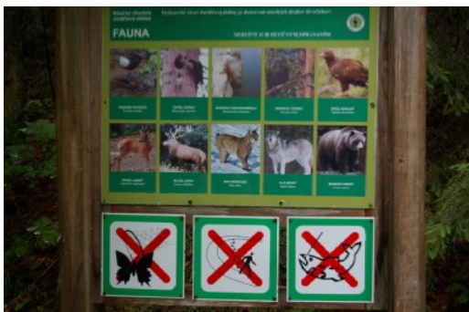
man beachte die letzten 3 Tiere rechts unten! (aber wir werden sie nicht sehen...)

Wir folgen weiterhin noch der roten Markierung und leider geht der Weg jetzt erst einmal wieder bergunter in das benachbarte Tal. Hier treffen wir auf den Talweg mit der blauen Markierung und jetzt muß sich jeder entscheiden.