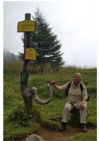
oben angekommen: 1.351 m

Für uns bleibt nur der gleiche Weg, den wir auch gekommen sind. Wir folgen der blauen Markierung zurück ins Tal nach Oravice. Links begleitet uns ein Bach.